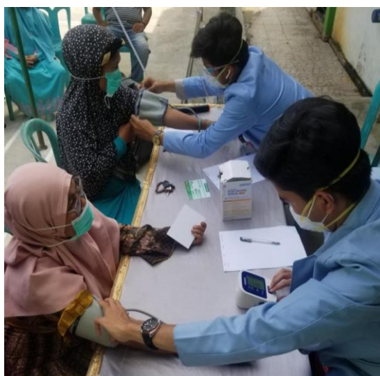
Gambar 2. Kegiatan pemeriksaan tekanan darah

Telah terlaksana kegiatan pengabdian masyarakat berupa penapisan tekanan darah tinggi sebagai upaya pencegahan penyakit ginjal kronis di RT 4, RW3, Kelurahan Bangkinang, Kota Bangkinang, Kabupaten Kampar. Adapun masyarakat yang mengikuti kegiatan ini sebanyak 100 orang dengan rincian 77 orang perempuan dan 33 laki-laki dan rerata usia 51 \pm 11 tahun.